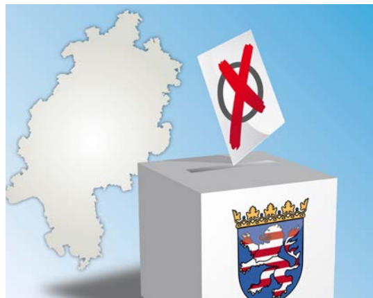
DIE NÄCHSTE LANDTAGSWAHL FINDET VORAUSSICHTLICH IM HERBST 2018 STATT.

ten bestimmten Wahlkreisen zugeordnet worden. Statt jetzt in einem Hau-Ruck-Verfahren das Gesetz zu ändern, schlage die SPD die Einsetzung einer Wahlkreiskommission vor, um eine Neuregelung für die übernächste Landtagswahl zu treffen.