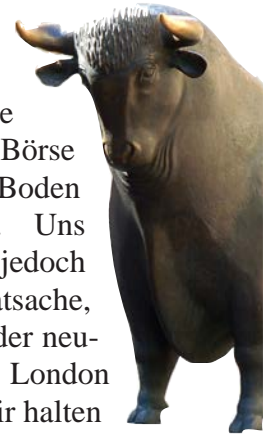
BULLE UND BÄR VOR DER FRANKFURTER BÖRSE STEHEN FÜR DAS AUF UND AB DER KURSE

Ohne eine mögliche Fusion droht die Deutsche Börse wertvollen Boden zu verlieren. Uns überzeugt jedoch nicht die Tatsache, dass der Sitz der neuen Holding in London liegen soll. Wir halten es für falsch, dass die Fusionsverhandlungen noch vor der Abstimmung über ein Referendum des Verbleibs Großbritannien in der Europäischen Union geführt werden.“ Die weitere Entwicklung müsse genauestens beobachtet werden und in das Genehmigungsverfahren der Börsenaufsicht einfließen.